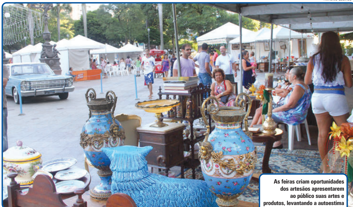
As feiras criam oportunidades dos artesãos apresentarem ao público suas artes e produtos, levantando a autoestima