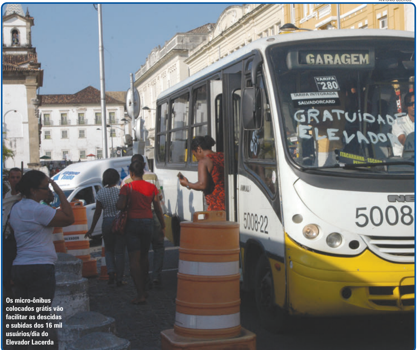
Os micro-ônibus colocados grátis vão facilitar as descidas e subidas dos 16 mil usuários/dia do Elevador Lacerda