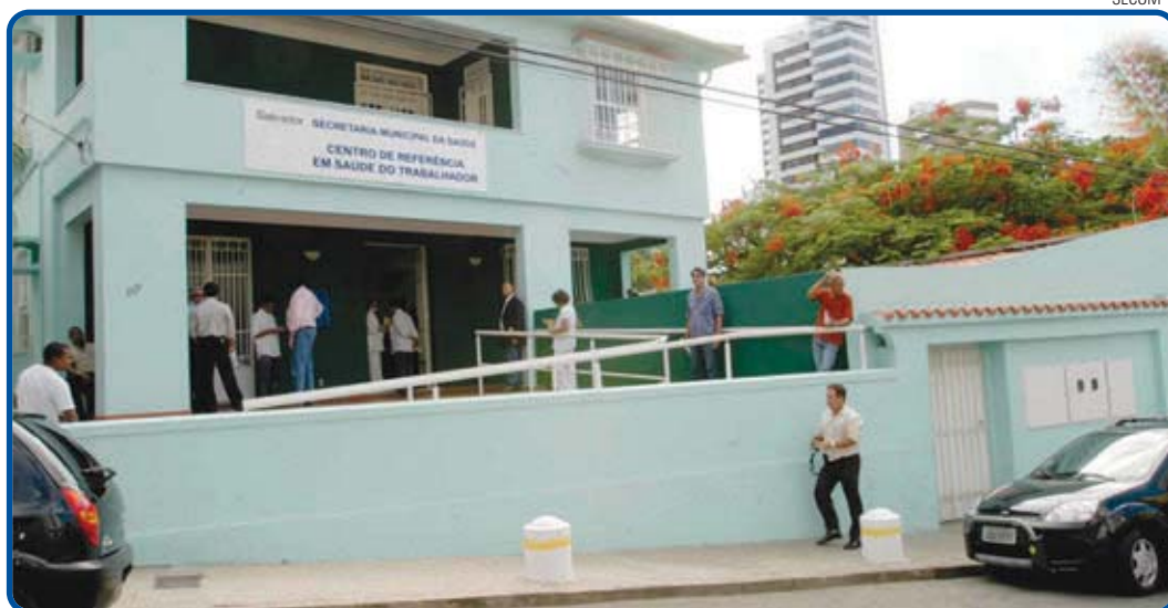
A Prefeitura do Salvador possui uma unidade regional especializada no atendimento à saúde do trabalhador