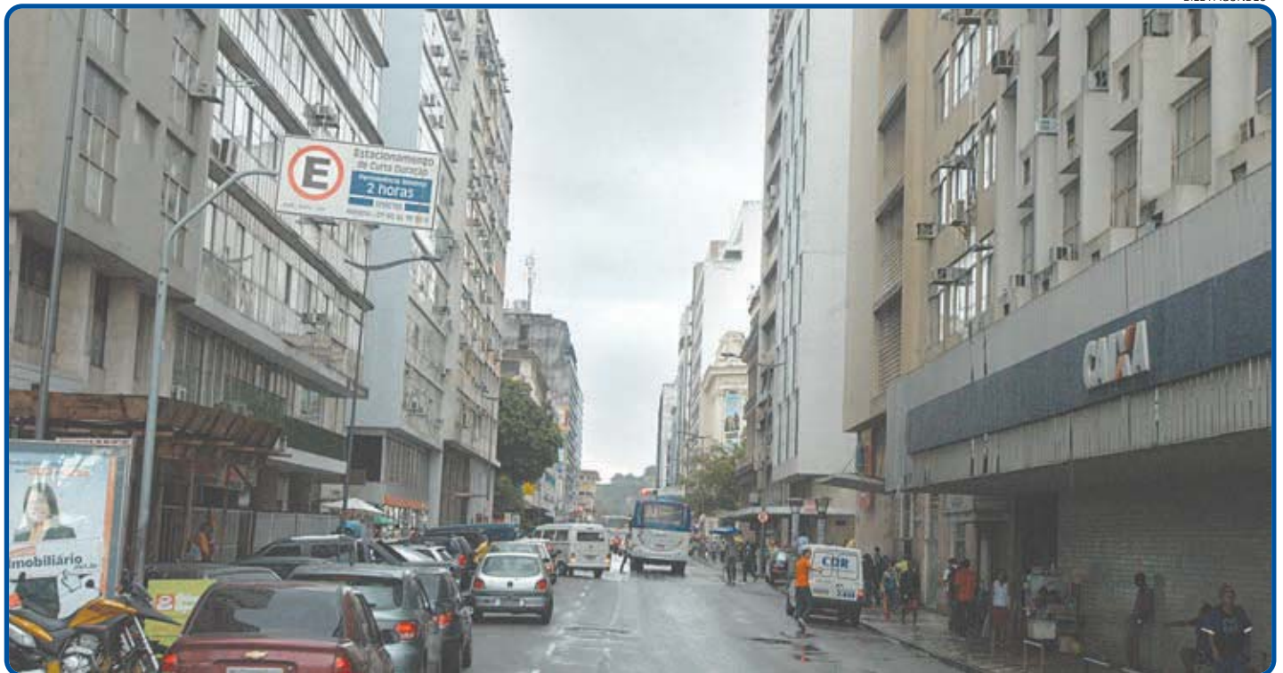
Os técnicos farão vistorias dos casarões do Comércio, ordenamento do trânsito, delimitação dos pontos para implantação de pontos de iluminação