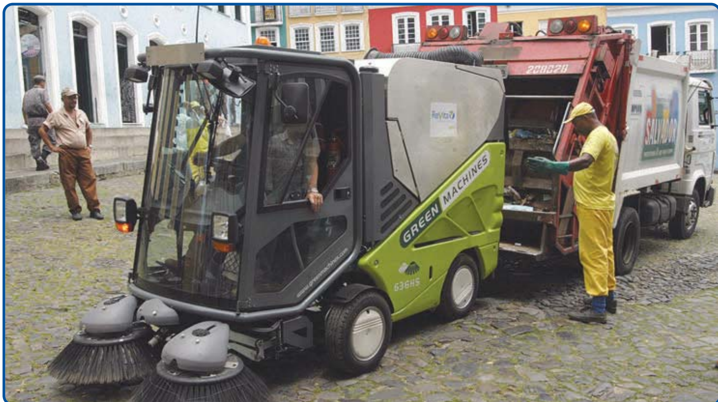
Coleta de lixo cinco vezes por dia, além da manutenção da iluminação no local, são alguns dos serviços mantidos pela Prefeitura no Centro Histórico