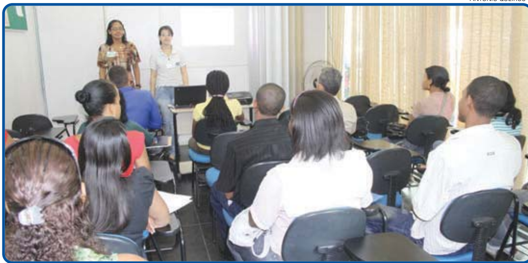
De março de 2010 a julho de 2012, o Simm realizou 202 oficinas e palestras gratuitas, com 4.321 profissionais