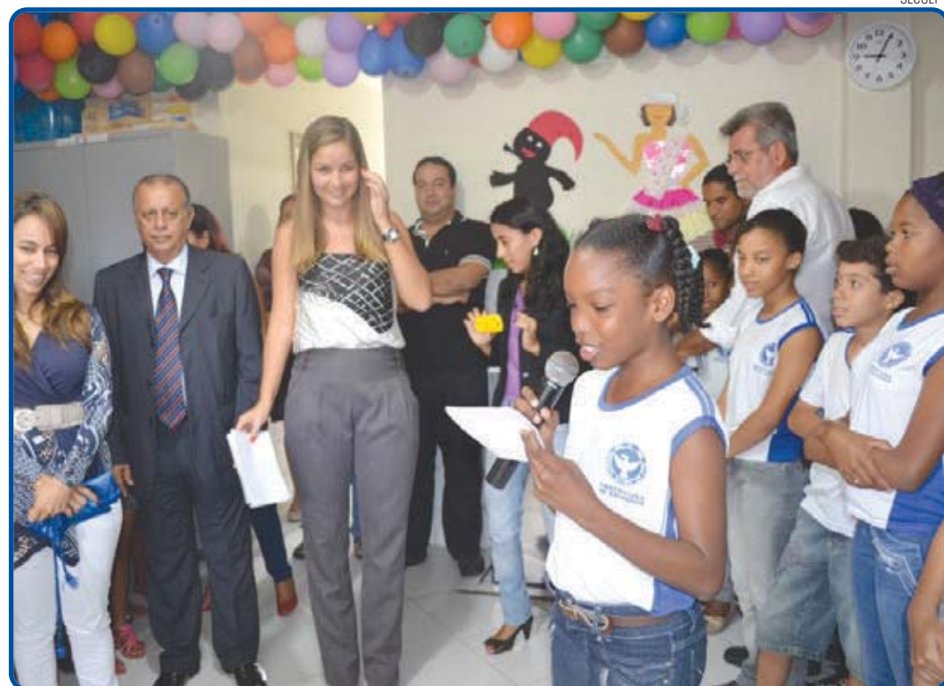
Estudantes, professores e funcionários participaram da reinauguração da escola, que atende a 185 alunos

“Com a inauguração dessa escola, a Prefeitura está nos devolvendo a dignidade, nos dizendo que é possível