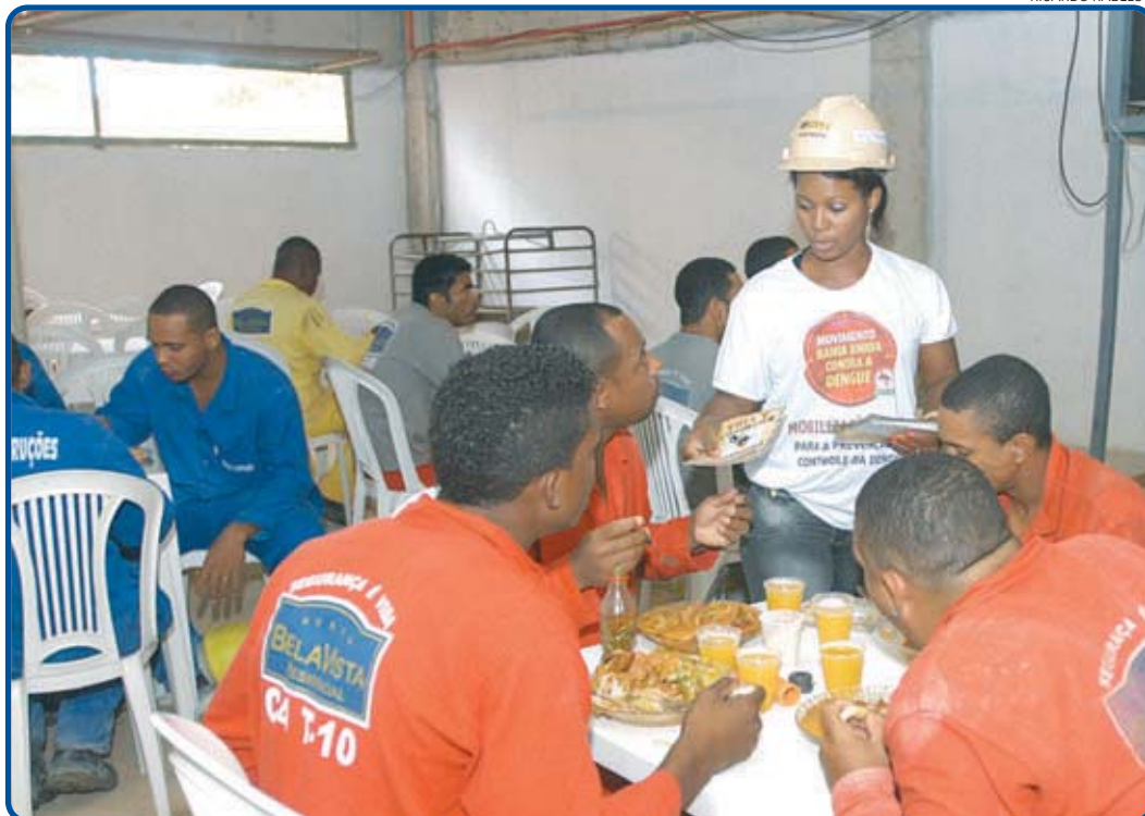
Durante o almoço, cerca de 200 operários receberam folhetos com informações sobre como prevenir a doença

Neste primeiro dia, a ação foi realizada no refeitório, durante o horário de almoço, e reuniu cerca de 200 operários. Além de distribuir folhetos que ensinam a identificar possíveis pontos de focos da doença, os agentes apresentaram um vídeo no qual é mostrado todo o ciclo de vida do mosquito Aedes aegypti .