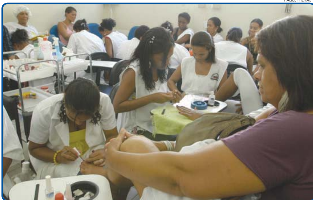
Ao fazer as unhas, o cliente deve ficar atento aos aspectos de limpeza e higiene dos instrumentos